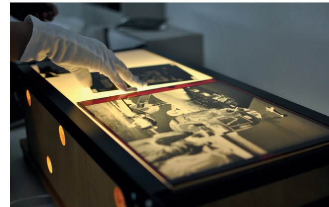
Luftbild-Negativ auf dem Leuchttisch

Das Archiv wurde 1975 bei der Bayerischen Vermessungsverwaltung eingerichtet. Im Rahmen der Heimatstrategie Bayern wurde das Luftbildarchiv 2018 nach Neustadt a.d.Aisch verlagert. Hier werden die analogen Luftbilder aufbewahrt, die digitalen werden in München gespeichert.