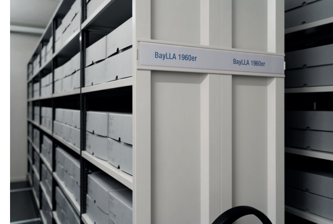
Blick in das Archiv in Neustadt a.d.Aisch

Das Bayerische Landesluftbildarchiv besitzt eine einzigartige Sammlung von über einer Million Luftbildern von ganz Bayern. Es zählt zu den größten Luftbildarchiven in Deutschland. Die ältesten Aufnahmen stammen aus den 1920er Jahren, die neuesten Luftbilder aus der aktuellen Bayernbefliegung.